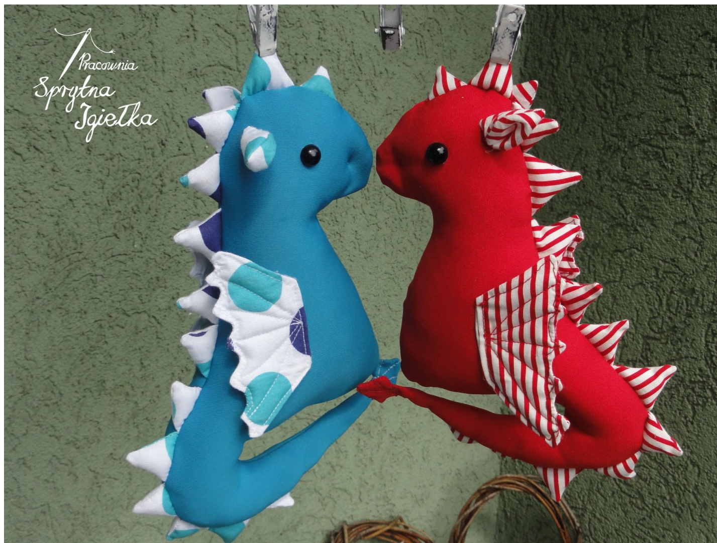
Smoki – wykonane na Dzień Ojca i Matki.