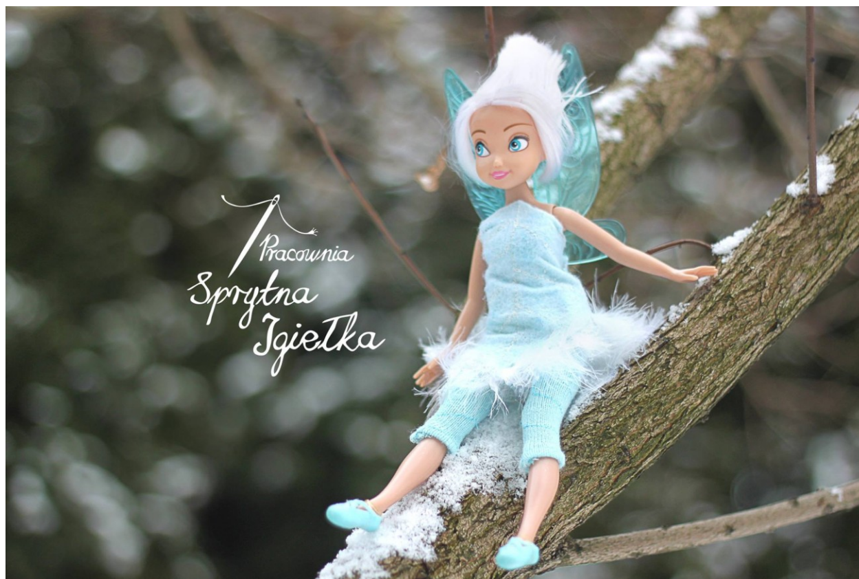
Barwinka – siostra Dzwoneczka – fanart