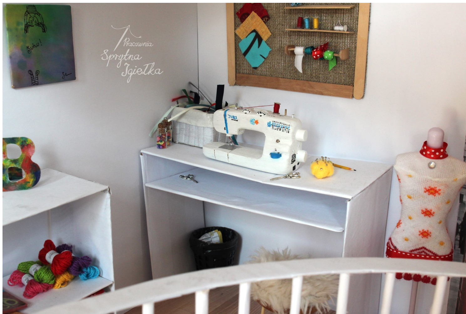
Pracownia krawiecka dla Barbie