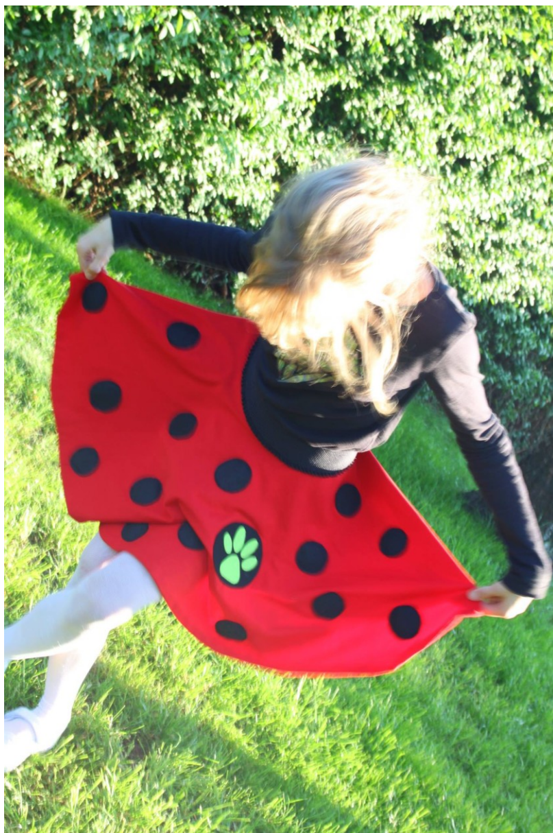
„Ja też chcę być Biedronką!” - Biedronka i Czarny Kot – fanart dla serialu.