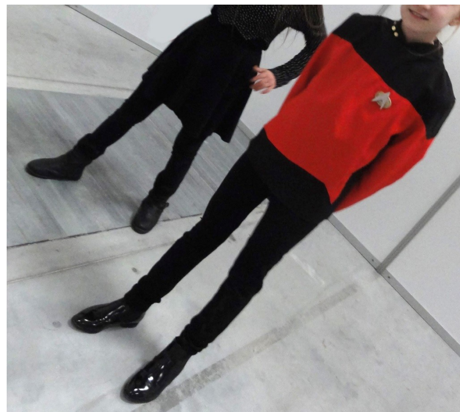
„Uważaj! Szkoliła mnie Gwiezdna Flota!” – mundur Star Trek.