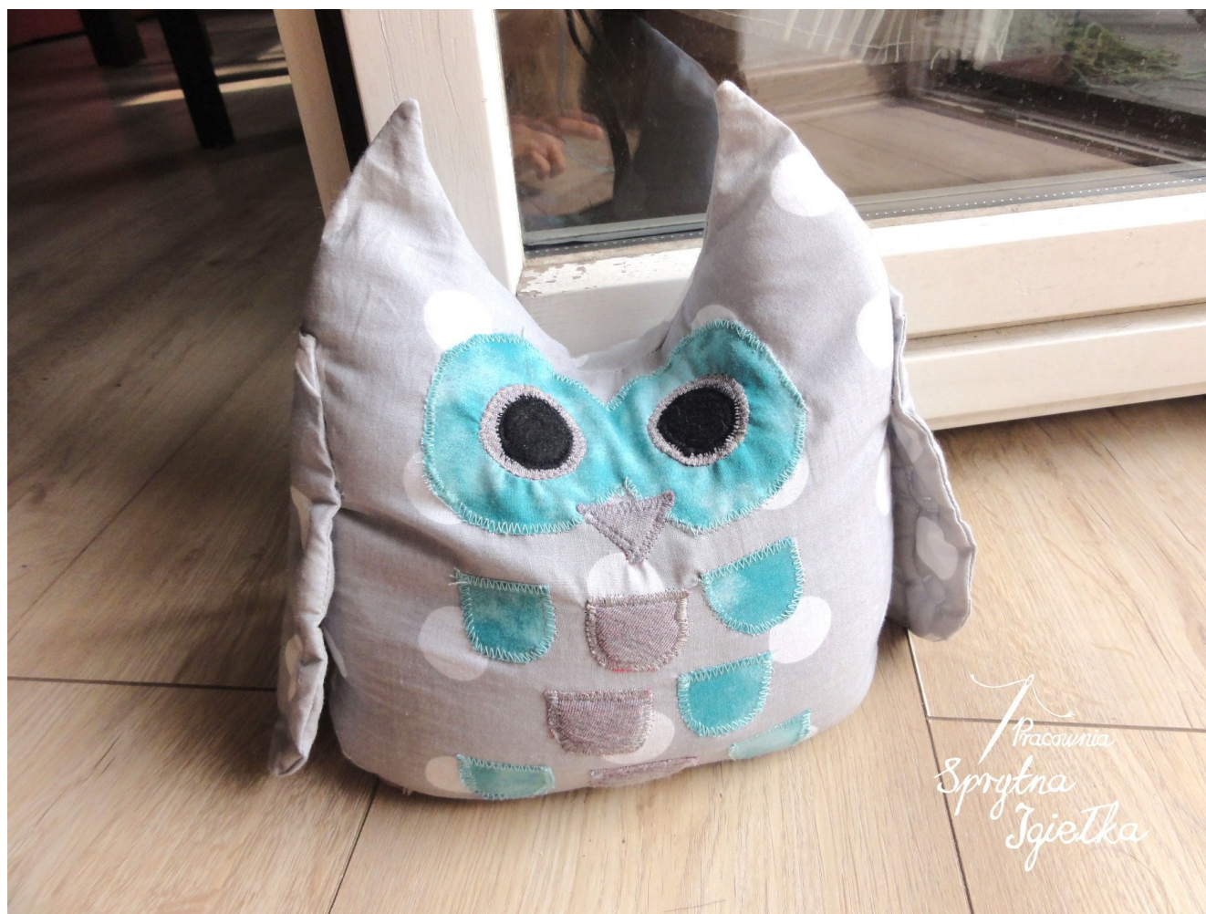
„Pan Sowa” – podpórka do drzwi balkonowych.