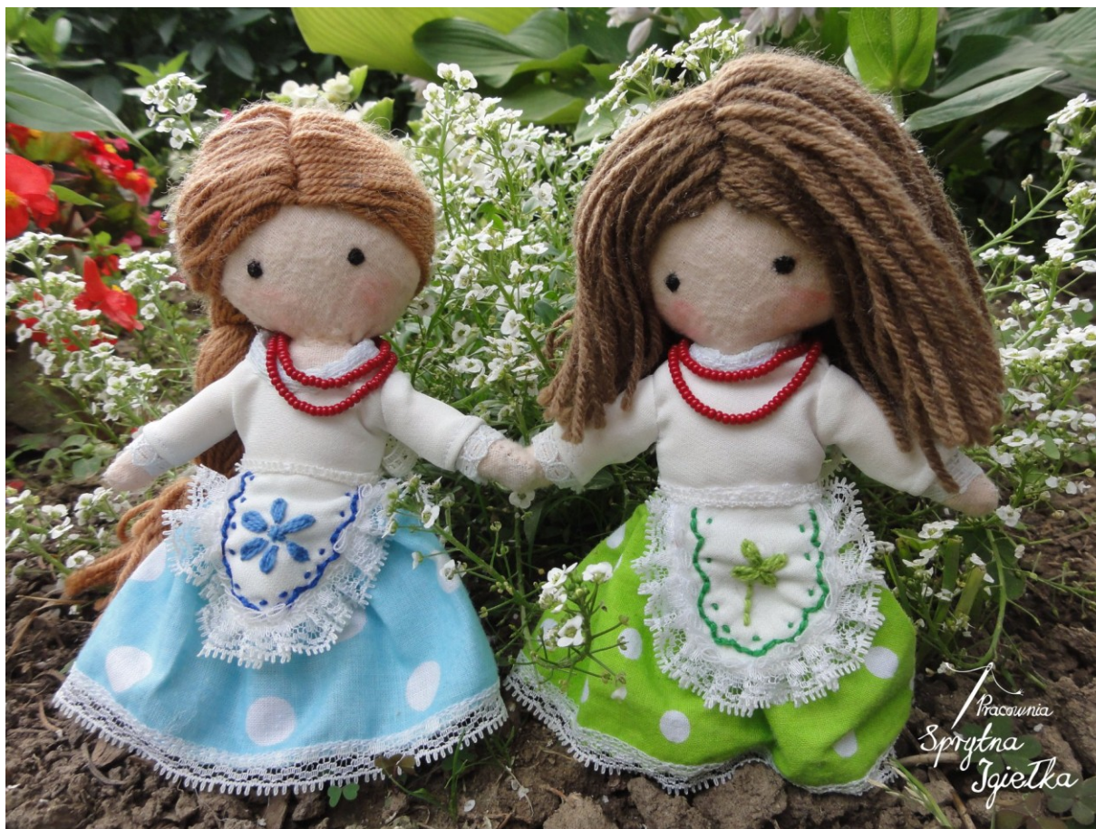
„Przyjaciółki” – laleczki „nierozłączki”. Niezbędnik przyjaciółek.