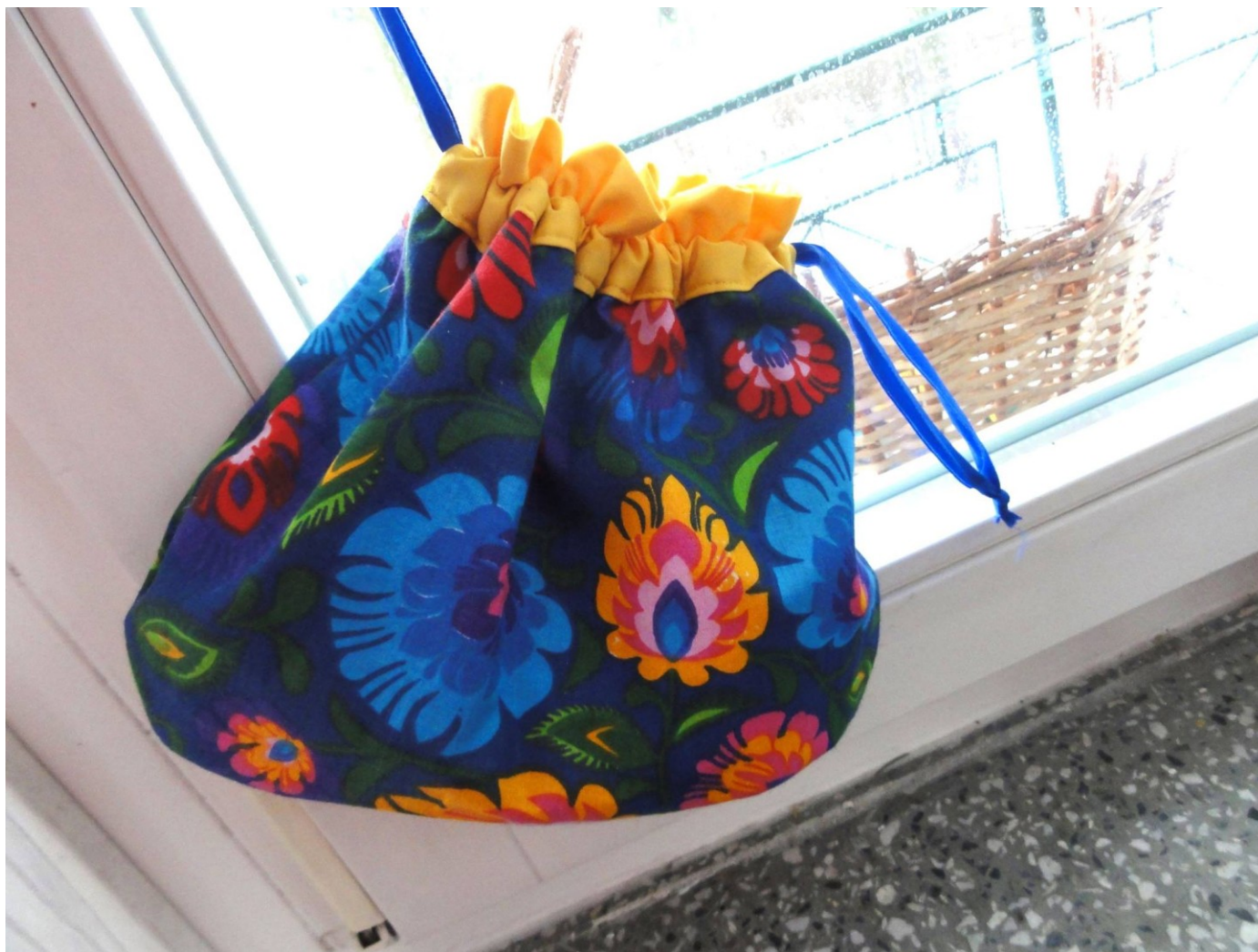
Woreczek na drobiazgi