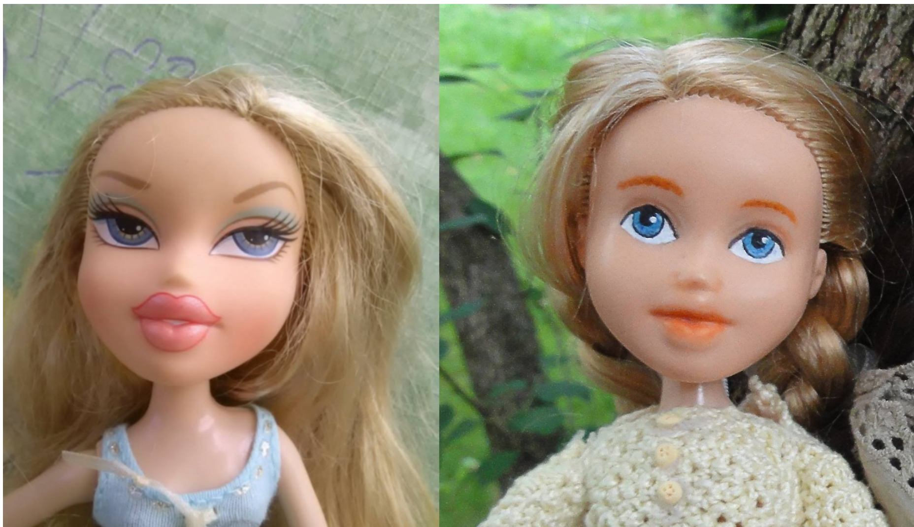
Przemalowywanie twarzy laleczki. „Przed” i „Po”.