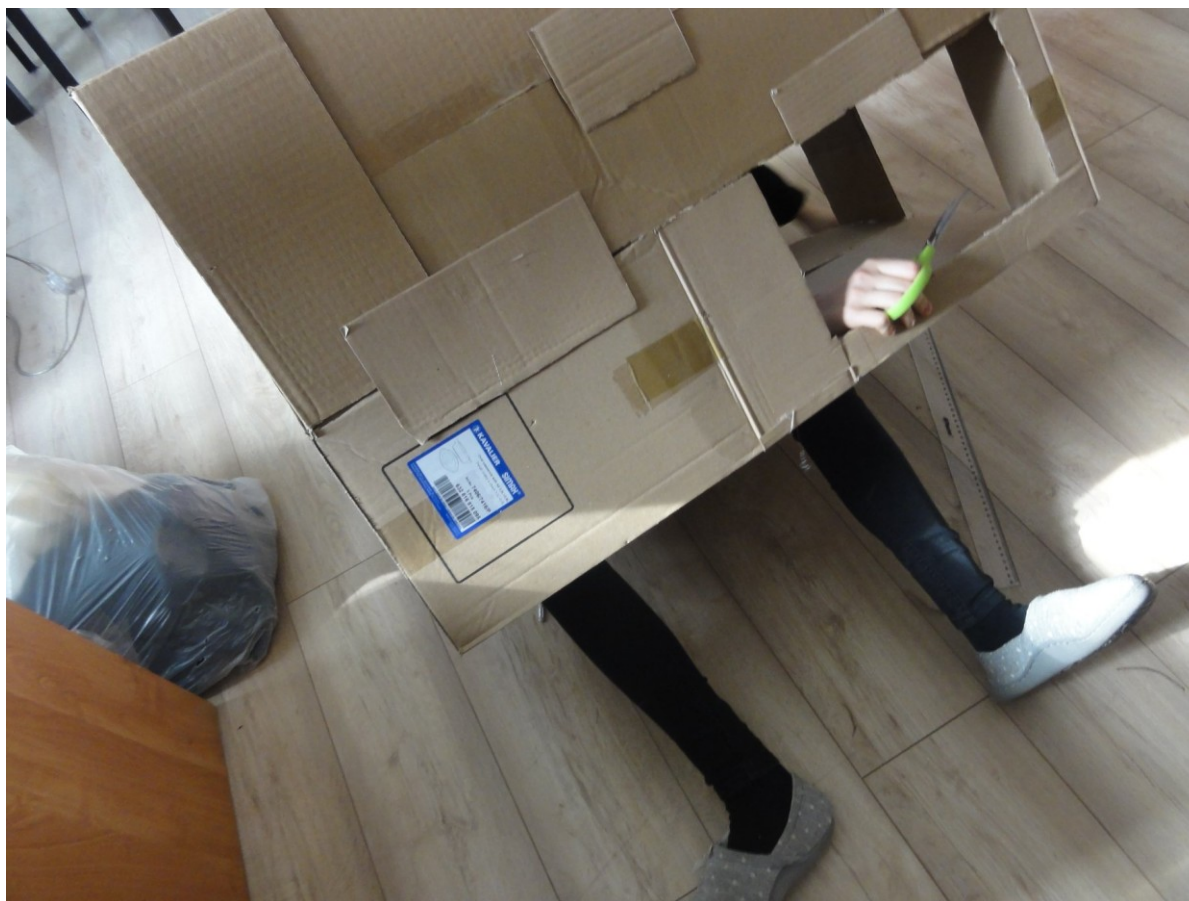
„Żyjąc w pudełku” – a raczej „Tworząc z pudeł” - konstrukcja domku dla lalek