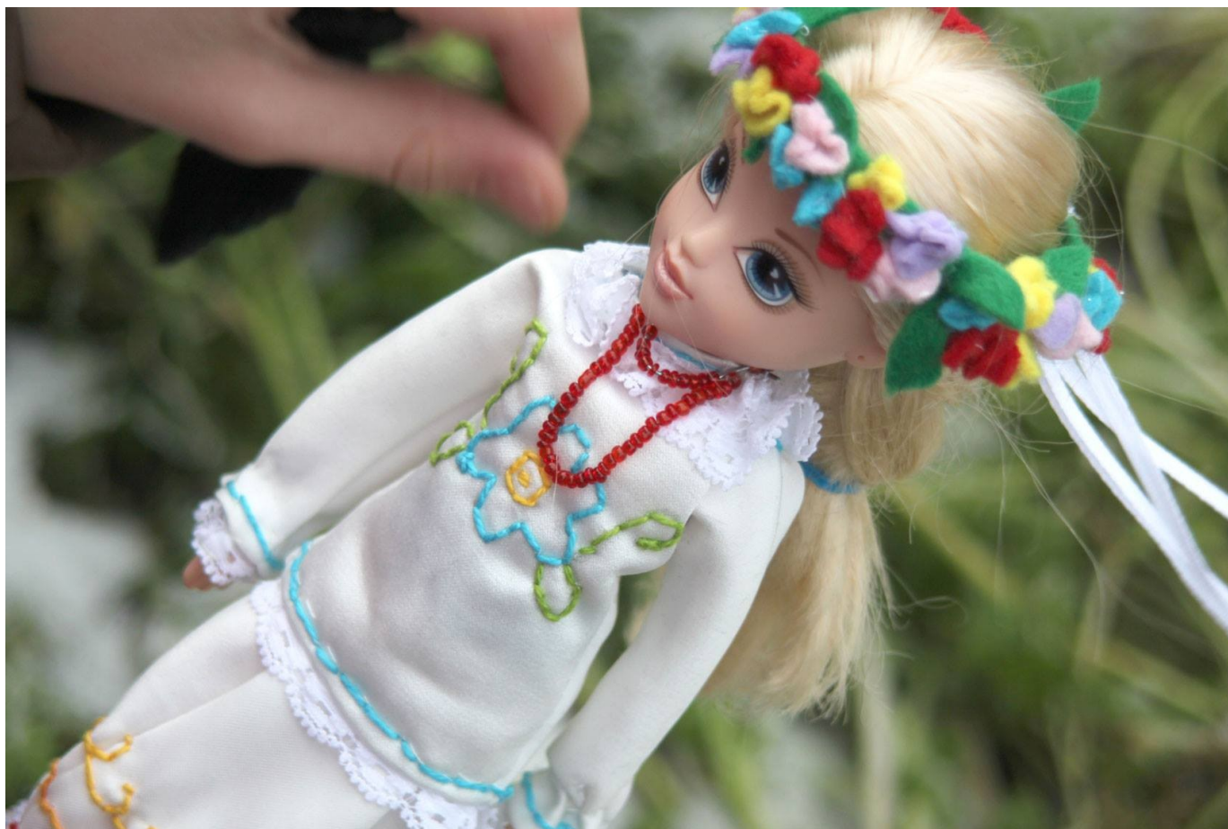
„Panna Wiosna” - strój wzorowany na folklorze.