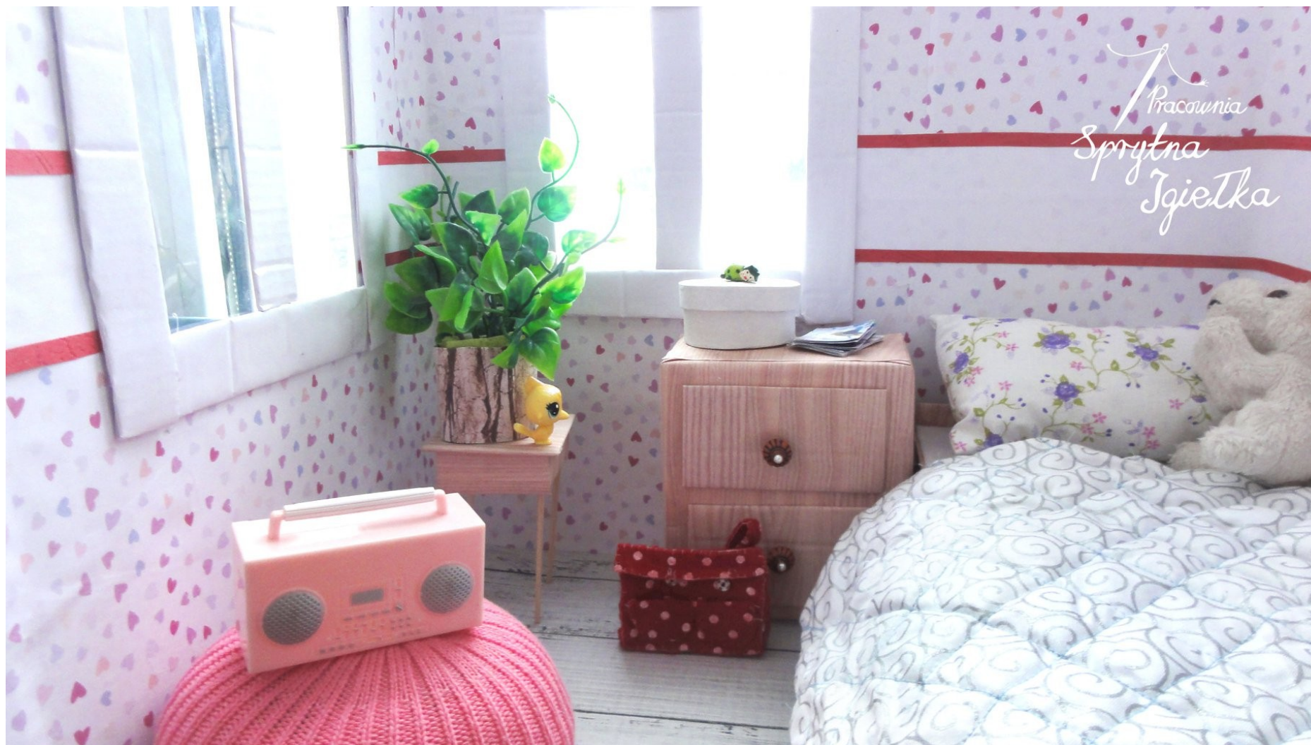
Domek dla Barbie – pokój nastolatki.