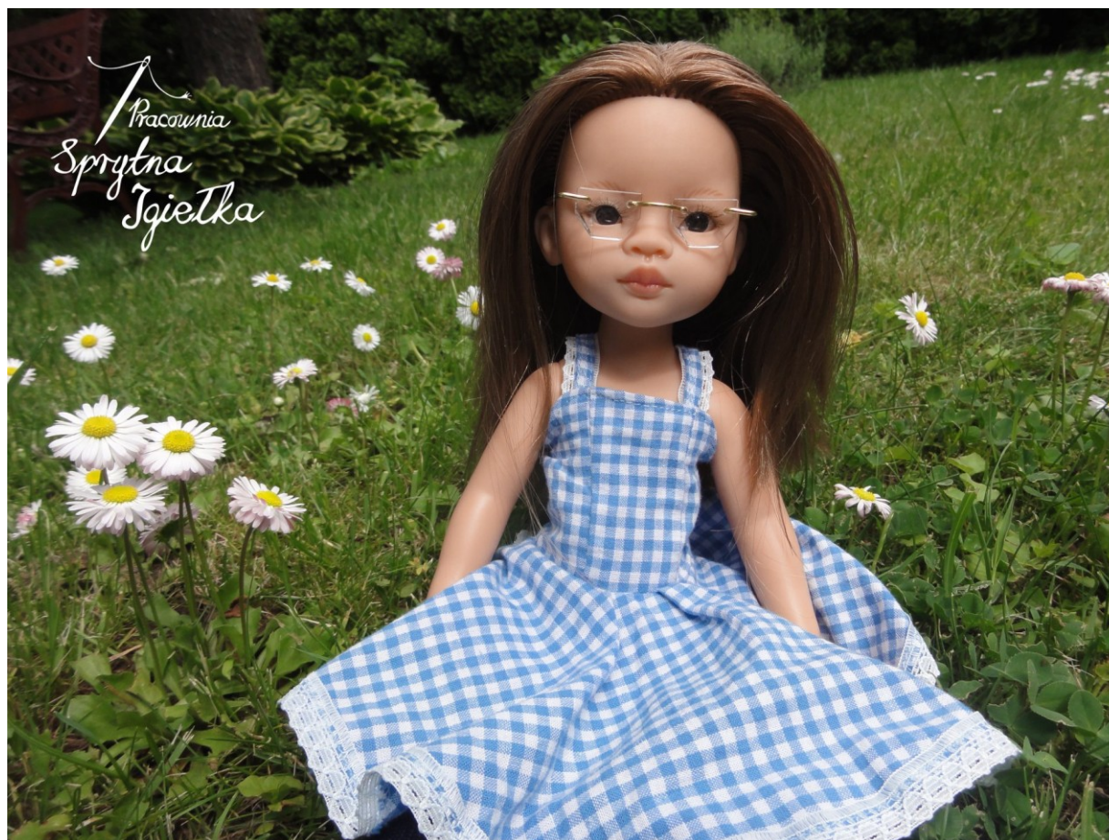
„Panna Lato” - klasyczna letnia sukienka dla lalki