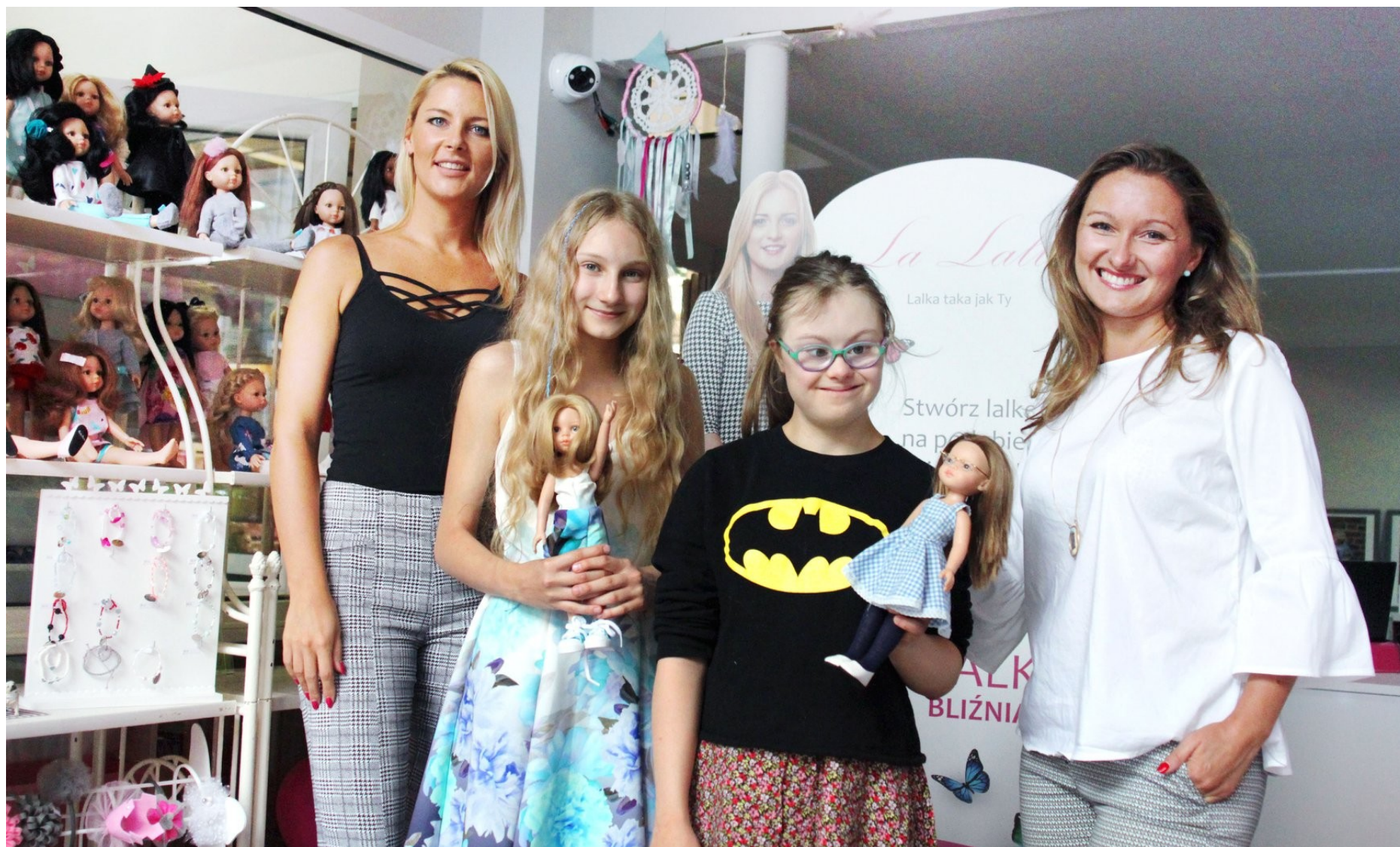
Ja i moja Siostra odwiedziłyśmy sklep firmowy znanej polskiej marki lalek. Udało nam się nawet poznać Panię Właścicielki Firmy.