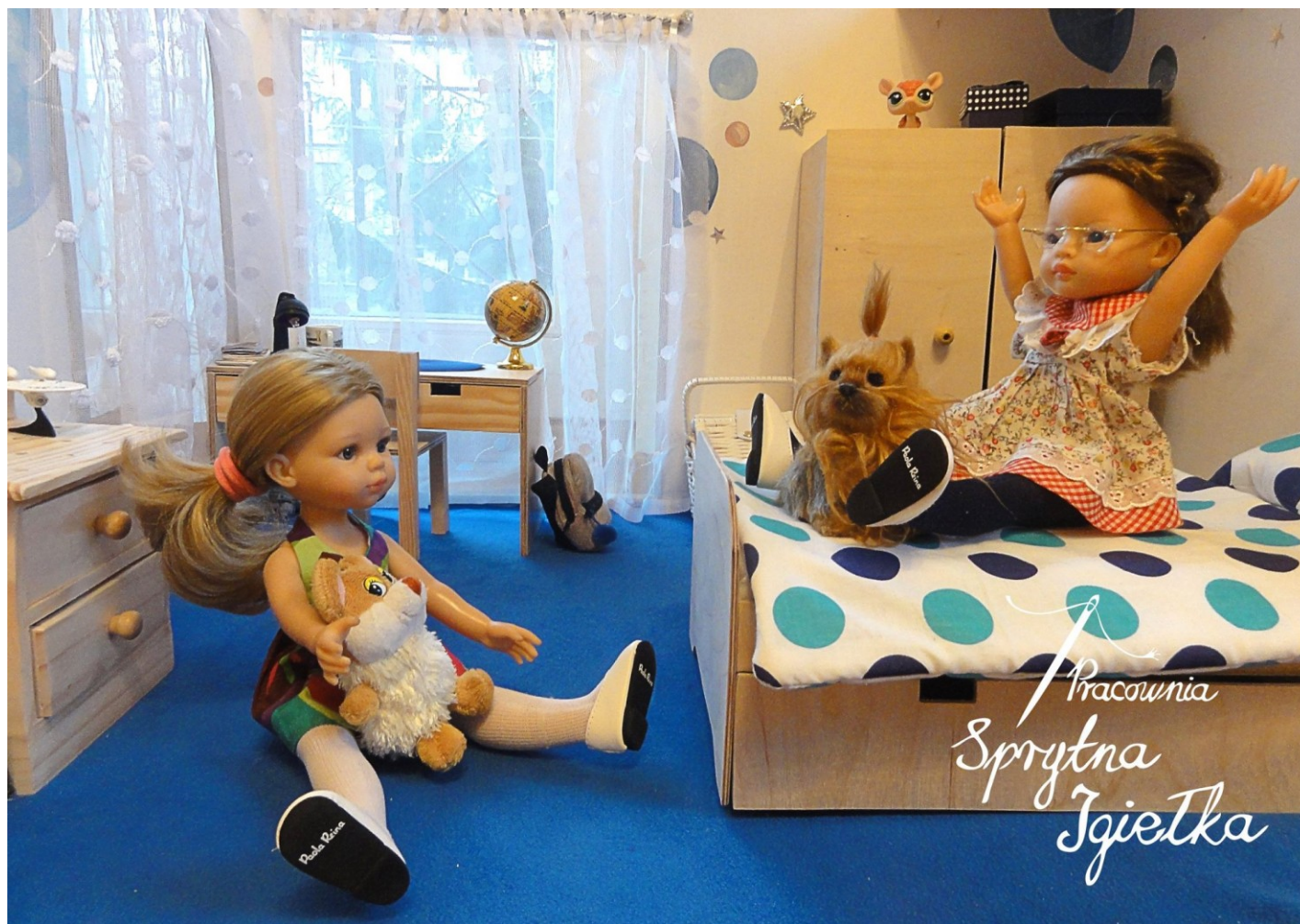
Domek dla lalek. Drewniane elementy wykonane ze sklejki – Tato zapewnił niezastąpione wsparcie techniczne w nauce „sztuk kreacji z drewna”.