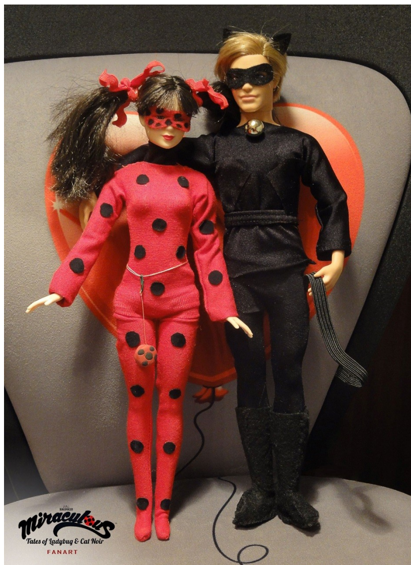
Serial „Biedronka i Czarny Kot” – Fanart.