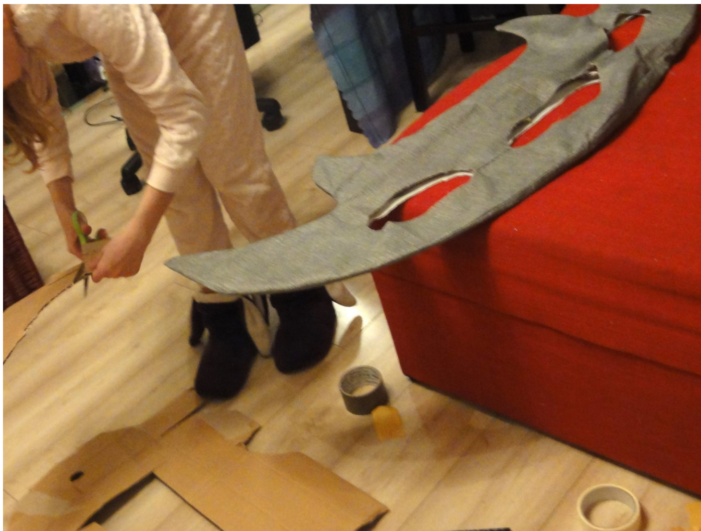
Klingońska broń obosieczna – fanart dla seriali Star Trek.