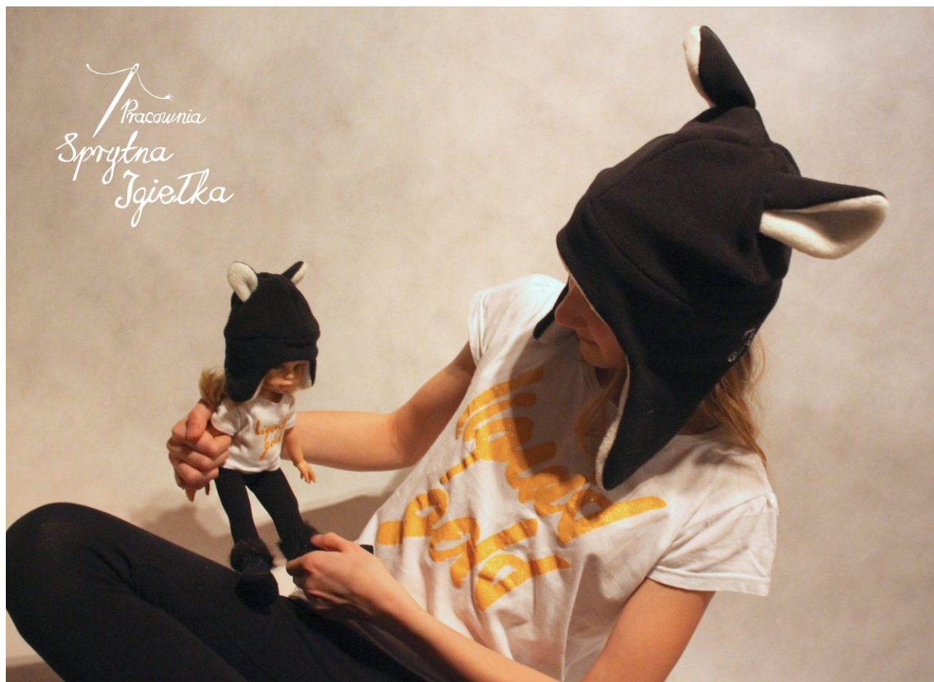
Czapka „uszatka” – wersja dla laleczki oraz jej właścicielki.