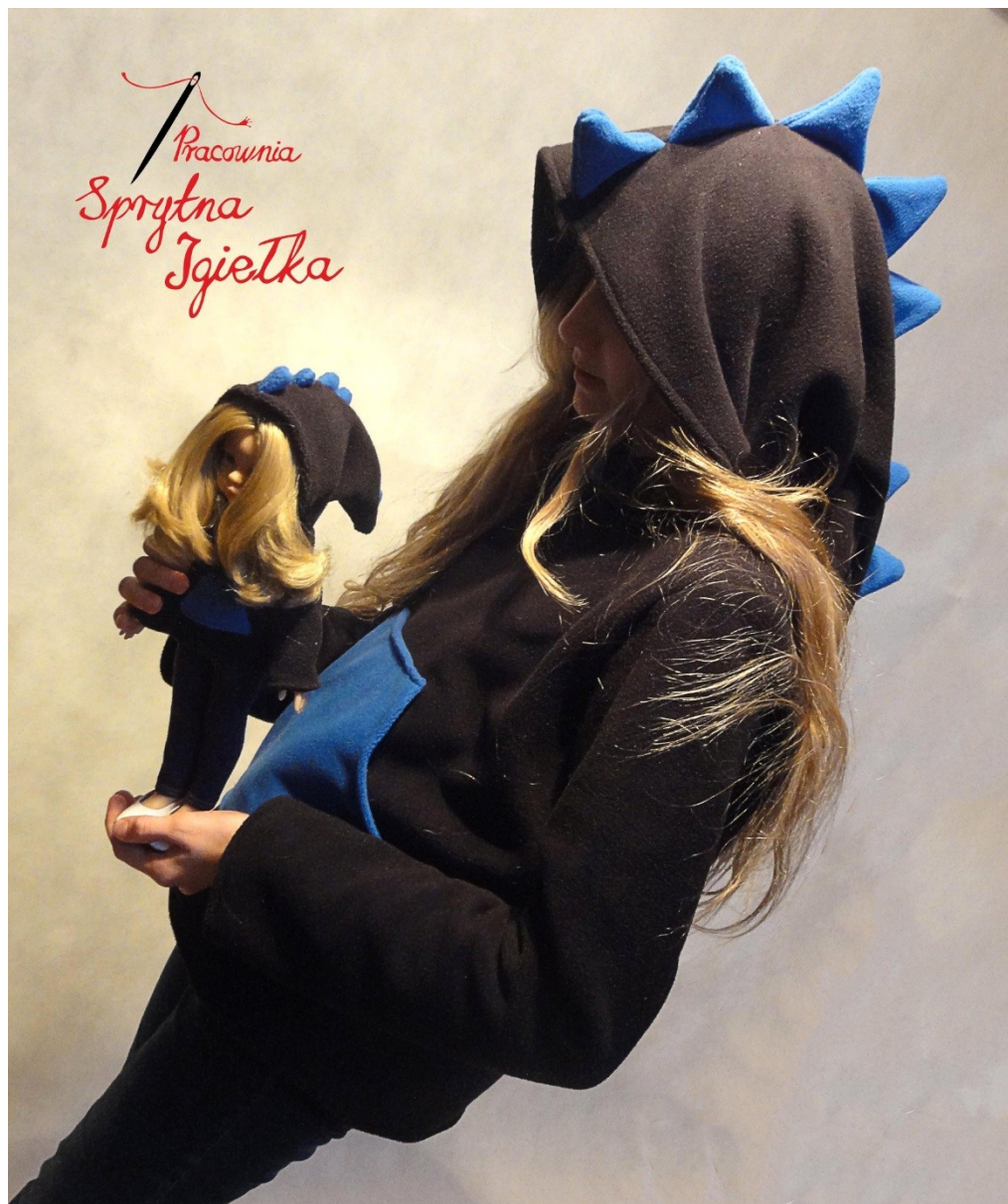
„Smocza skóra” – bluza z kapturem. Lalka + dziecko.