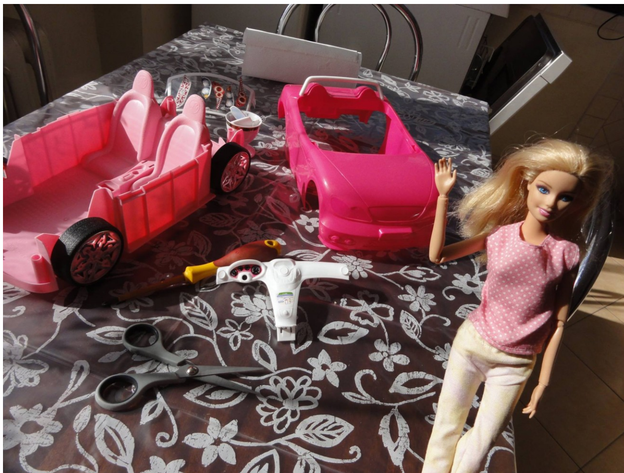
Auto przed przemianą. Tradycyjny Barbie-róż zastąpiłam głębokim granatem.