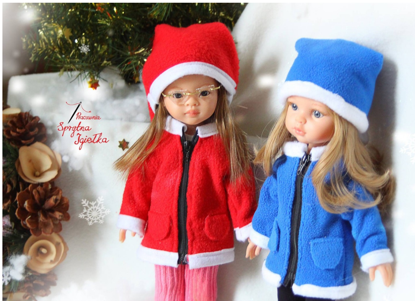
„Święta tuż tuż”