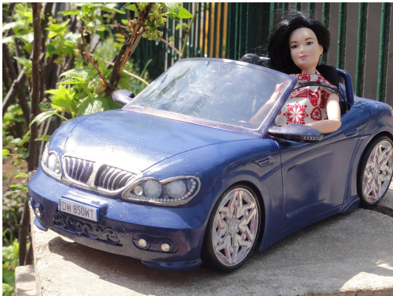
„Auto detaling” + „lakiernik”